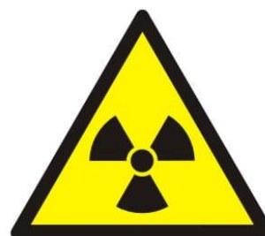
Promieniowanie jonizujące (rentgenowskie)