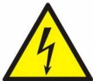
Niebezpieczeństwo porażenia prądem elektrycznym