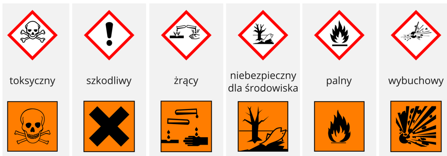
Oznaczenia substancji chemicznych