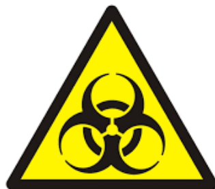
Skazanie biologiczne (materiał zakaźny)