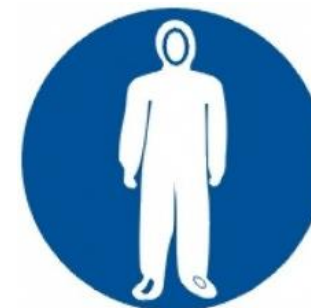
Nakaz stosowania kombinezonu ochronnego